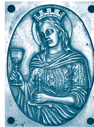
Η ΑΓΙΑ ΒΑΡΒΑΡΑ ΩΣΤΟΙ ΤΟ ΠΥΡΟΒΟΛΙΚΟΝ

ΤΡΙΜΗΝΙΑΙΑ ΕΦΗΜΕΡΙΔΑ ΤΟΥ ΣΥΝΔΕΣΜΟΥ ΑΠΟΣΤΡΑΤΩΝ ΑΞΙΩΜΑΤΙΚΩΝ ΠΥΡΟΒΟΛΙΚΟΥ «ΑΝΘΛΟΣ (ΠΒ) ΠΑΥΛΟΣ ΜΕΛΑΣ»