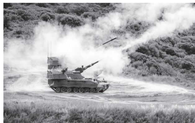
Α/Κ ΟΒΙΔΟΒΟΛΟ 155ΧΙΛ. PZH2000GR

Παρά την ανωτερότητά του, το PzH 2000 στην ελληνική υπηρεσία χρειάζεται προσοχή: