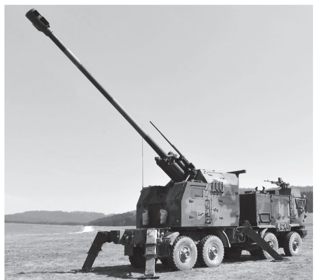
Αυτοκινούμενο σύστημα NORA-B52 155mm (Yugoimport SDPR) με ορατά τα τέσσερα εξωτερικά πτυσσόμενα πόδια στήριξης.

Στρατηγική Κινητικότητα: Τα τροχοφόρα μπορούν να μετακινηθούν ταχύτατα μέσω του εθνικού οδικού δικτύου χωρίς την