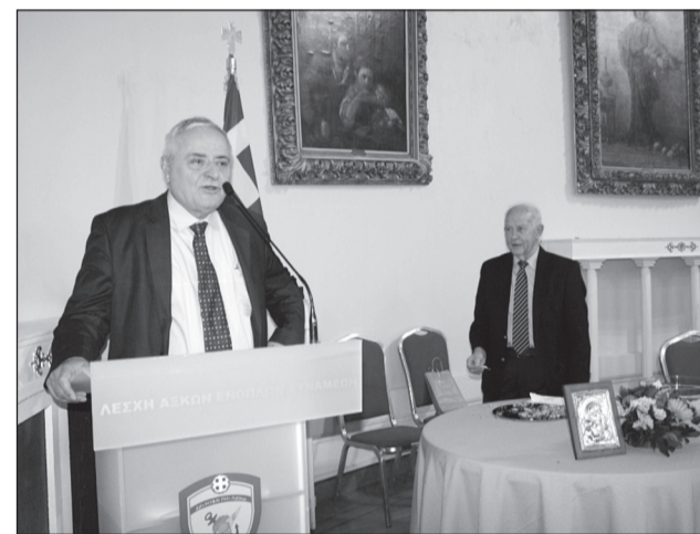
Ο Πρόεδρος μας