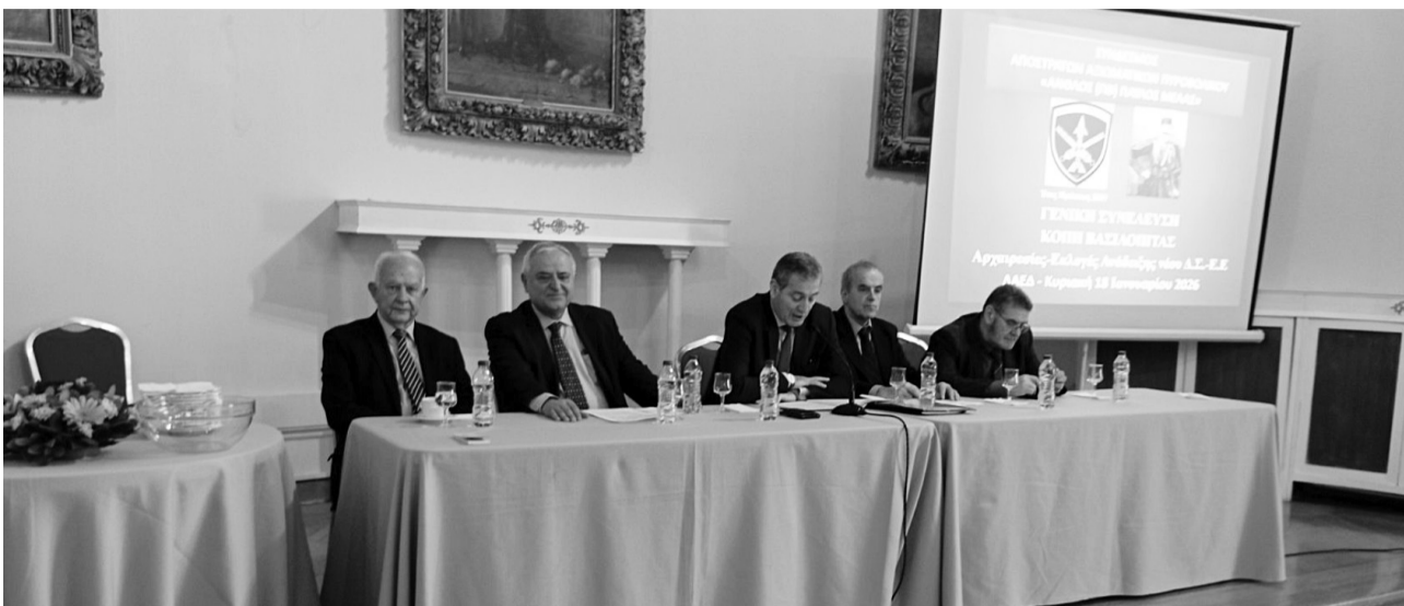
Η τριμελής επιτροπή διεύθυνσης των εργασιών

Ακολούθως ο Πρόεδρος της Εξελεγκτικής Επιτροπής Υπτγος ε.α. κ. Ιωάννης Σκαρπέλος ανακοίνωσε την έκθεση της Επιτροπής και πρότεινε την έγκριση των δαπανών χρήσεως του έτους 2025 και την απαλλαγή του ΔΣ από την ευθύνη, εγκρίθηκε δε με χειροκροτήματα. (Ο Απολογισμός, προγραμματισμός του ΔΣ και η Έκθεση της Εξελεγκτικής Επιτροπής δημοσιεύονται στη σελίδα 5).