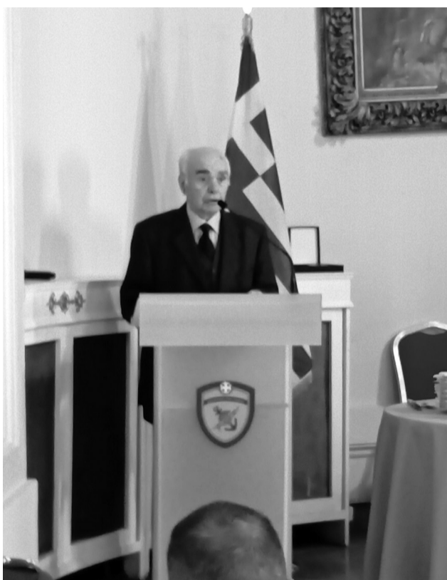
Ο Πρόεδρος της Εξελεγκτικής Επιτροπής Υπτγος ε.α. Ιωάννης Σκαρπέλος

Την εκδήλωση τίμησαν με την παρουσία τους :