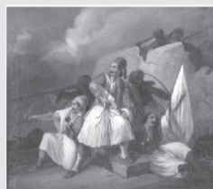
ΟΙ ΑΘΛΟΙ, Ο ΠΟΛΙΤΙΣΜΟΣ ΚΑΙ ΟΙ ΑΡΕΤΕΣ ΤΩΝ ΑΓΩΝΙΣΤΩΝ ΤΟΥ 1821